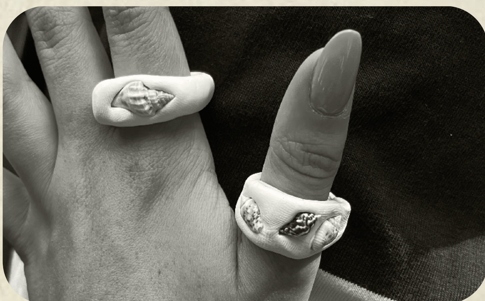
Anel Lutraria e Cardium